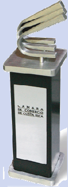
Galardón Fedecámaras 2010