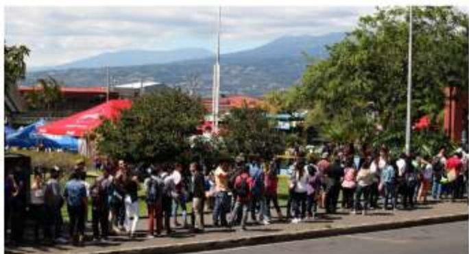
17/11/2017 Coronado. Cientos de personas en busca de empleo llegaron al Parque de Coronado donde la Municipalidad del Cantón organizó una feria para ayudar a quienes necesitan un empleo.

Esto tiene un efecto negativo sobre las familias y la sociedad en general, al traducirse en descomposición social, lo cual se evidencia en el aumento en la criminalidad, la drogadicción y otros males sociales. Sobre todo en ausencia de un seguro de desempleo, el problema demanda reformas urgentes al mercado de trabajo y al sistema educativo.