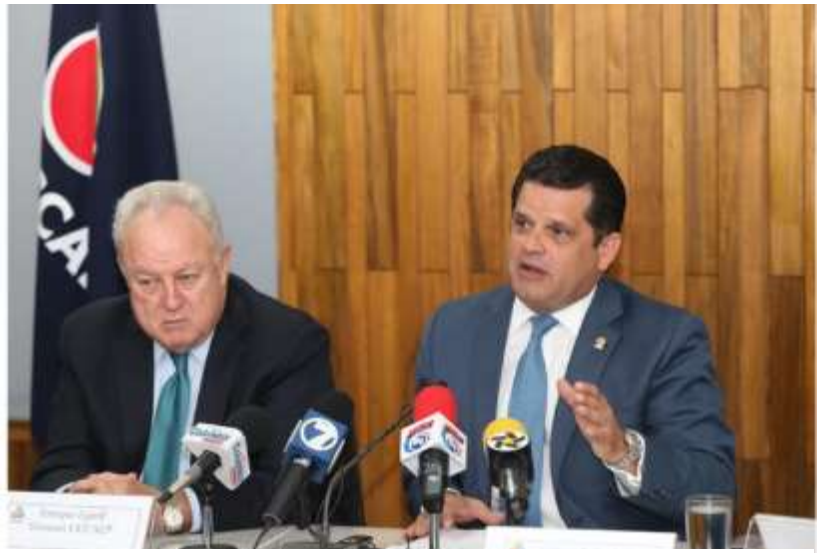
El Pulso Empresarial determinó que el 80% de los consultados considera que las tarifas eléctricas son muy caras.

Estas cifras se desprenden de la Encuesta Trimestral de Negocios Pulso Empresarial que realiza la Unión Costarricense de Cámaras y Asociaciones del Sector Empresarial (Uccaep), cuyos resultados correspondientes a la primera medición del 2018 fueron presentados este miércoles 14 de febrero.